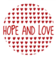
Hope and Love