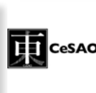
Centro Studi sull'Asia Orientale raccolta fondi