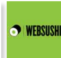
WebSushi Sito Web