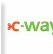
C-Way Operator Acquario di Genova visita acquario