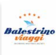
Balestrino Viaggi servizio pullman