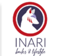
Inari Store raccolta fondi