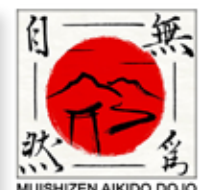
Mui Shizen Aikido attività bimbi raccolta fondi