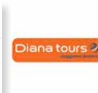
Diana Tours servizio pullman