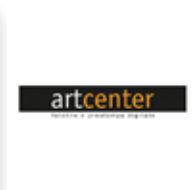
Art Center digital print