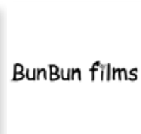
Bun Bun Films proiezione film