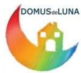
ドムス・デ・ルナ財団