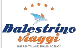
バレストリーノ ヴィアッジ