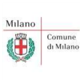
Comune di Milano