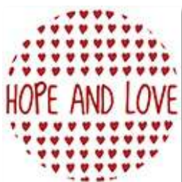
Hope and Love for Japan