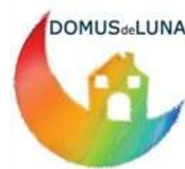
Fondazione Domus de Luna