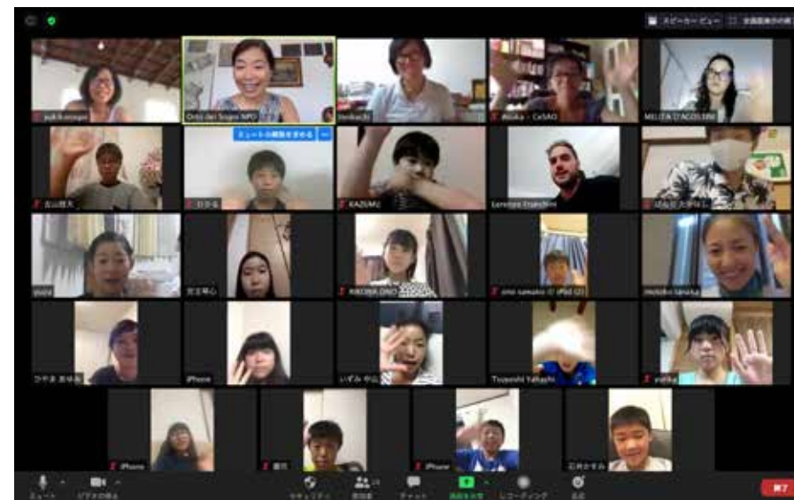
Incontro online partecipanti 2019

Al momento stiamo organizzando gli incontri online per i partecipanti dal 2015, a ritroso fino al 2012, anno in cui c'è stata la prima edizione del nostro soggiorno di risanamento.