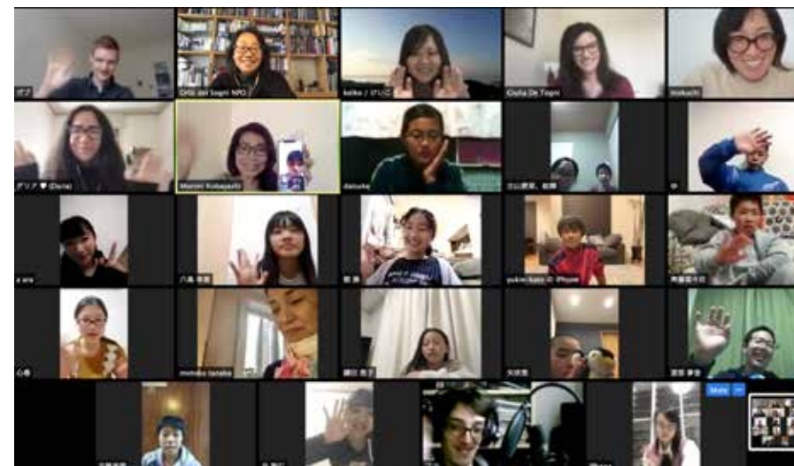
Incontro online partecipanti 2018