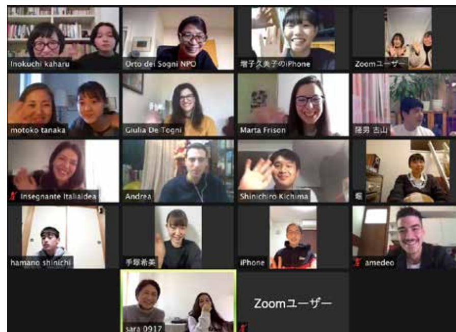
Incontro online partecipanti 2016