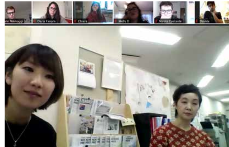
I soci italiani di Orto dei Sogni hanno fatto alcune domande a Tarachine, che ha risposto in modo molto esauriente e facilmente comprensibile.