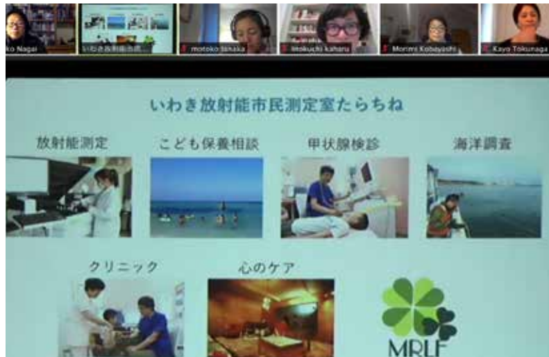
Seminario online sulla piattaforma ZOOM

L'incontro è stato registrato e sarà sottotitolato in italiano e reso disponibile per il pubblico, grazie alla collaborazione dei nostri stagisti ed ex-stagisti studenti di giapponese dell'Università Ca' Foscari Venezia, in modo che chiunque sia interessato abbia accesso a queste informazioni di prima mano sull'attuale situazione a Fukushima.