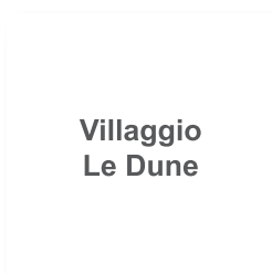
Villaggio Le Dune