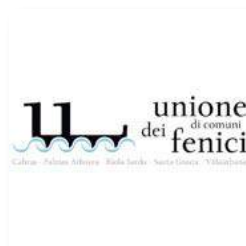
Unione di Comuni dei Fenici