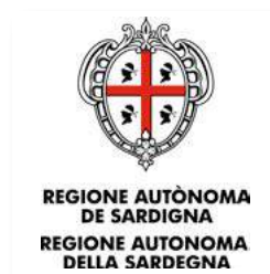
Regione Autonoma della Sardegna