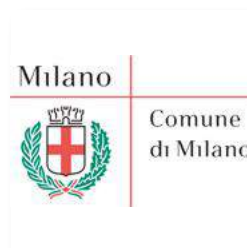
Comune di Milano