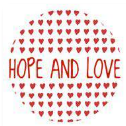
Hope and Love for Japan